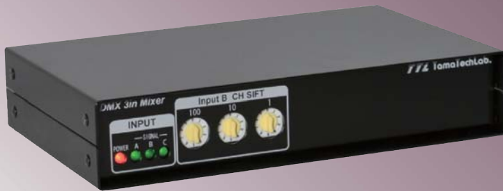
DMX 3in Mixer HR-DMX 3in Mixer

DMX 3in Mixer、HR-DMX 3in Mixerは3系統のDMX512信号をHTPまたはLTPでマージします。A,B,C3系統の入力のうちB系統はチャンネルシフト機能があります。通常はA,B,C3系統の入力をHTP(高レベル優先)でミックスして出力します。LTPモードではA,B,C3系統の入力のうち最後に変化したレベルが出力されます。これはチャンネル毎に比較してチャンネル毎にLTP切り替わります。例:すべてA系統のレベルで出力されている時にB系統でチャンネル1だけ変化した場合、出力のチャンネル1だけがB系統のレベルになり他のチャンネルはA系統のレベルのままになります。