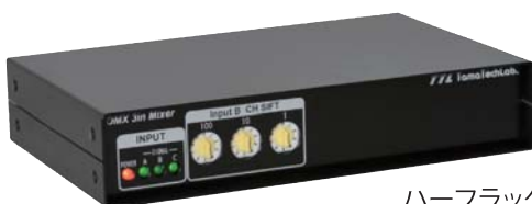
ハーフラックサイズ HR-DMX 3in Mixer

電源 AC90-240V 50/60Hz 15W サイズ W480×D200×H44mm(突起除く) 重量 1.5kg