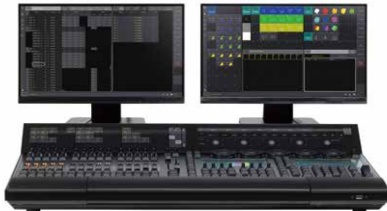
grandMA3 light CRV + 別売外付けマルチタッチスクリーン例