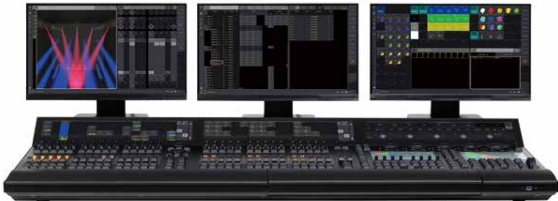
grandMA3 full-size CRV + 別売外付けマルチタッチスクリーン例